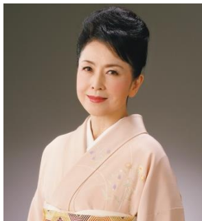
五大路子（横浜夢座）