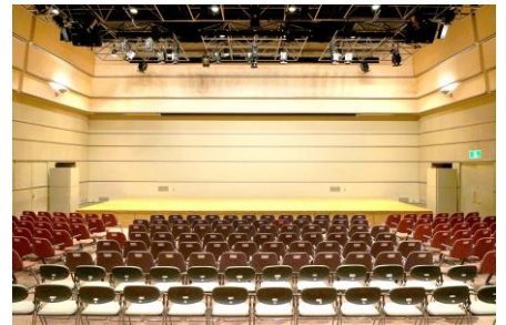
（サンハート ホール）