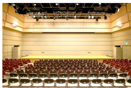
（サンハート ホール）